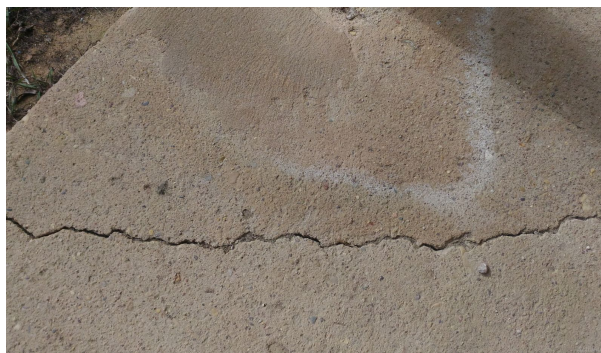
Plaisa skatuves grīdā.