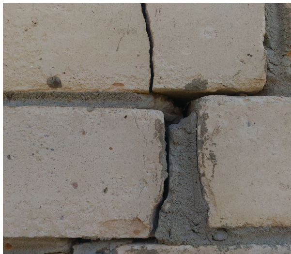
Plaisas ēkas ārsienā.