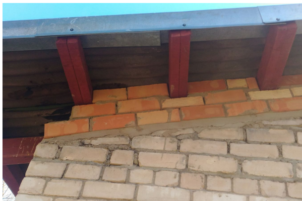
Jumta konstrukcijas. Sienas piemūrējums.