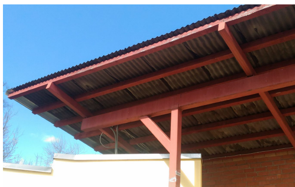
Bojāts jumta seguma materiāls.