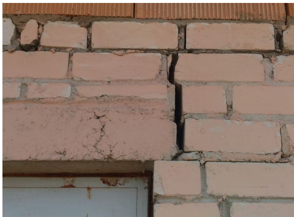
Plaisa sienā. Nepietiekams balsts durvju aillas pārsedzei.