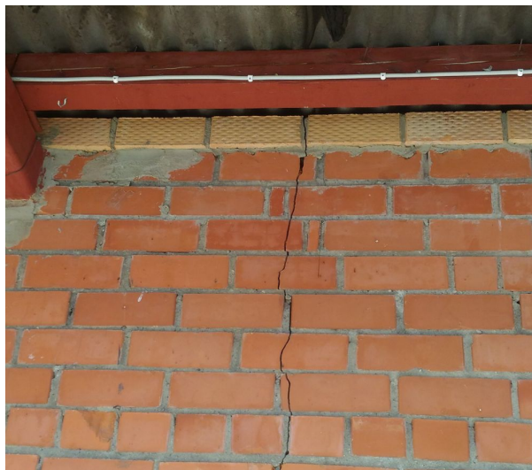
Sienas fragments skatuves daļā. Caurejoša plaisa.